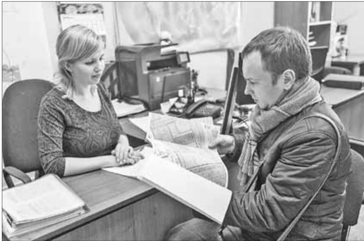
■ Заявителю выдается полный пакет документов.

Раньше исполнитель (а это определенный чиновник мэрии) при прямом контакте с заявителем (частным лицом, индивидуальным предпринимателем, представителем крупной фирмы и т.д.) мог начать гонять заявителя: принеси мне сегодня синенькую бумажку, а завтра достань зелененькую, сходи еще в такой-то отдел... Порой таким образом намеренно затягивалось решение вопроса.