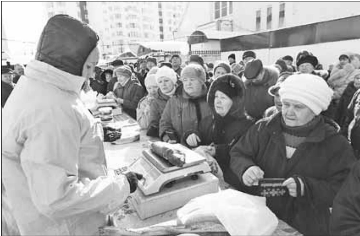
■ За свежей рыбой всегда выстраиваются очереди.