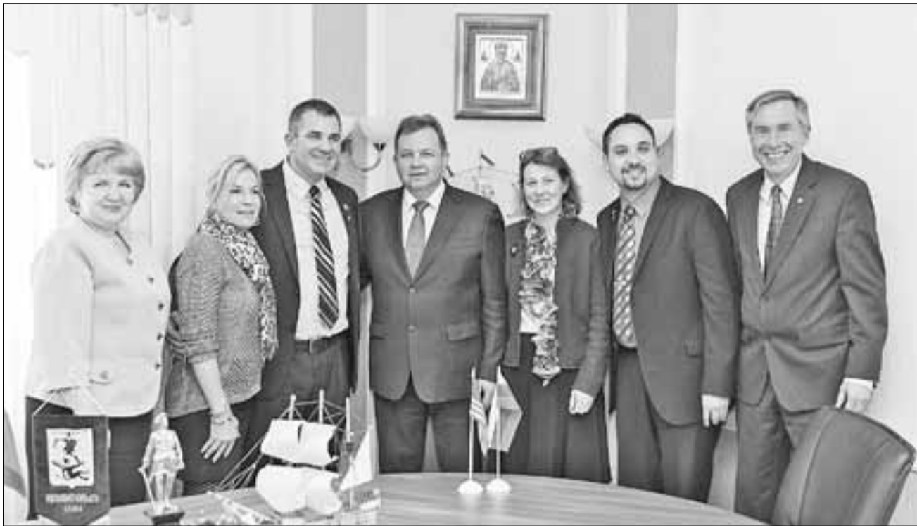
■ Встреча прошла в теплой дружеской обстановке.